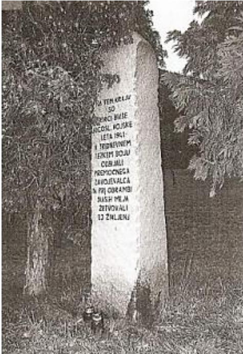
Spomenik padlim vojakom Dravske divizije aprila 1941 pri Dravogradu

dejansko našel tudi prvo civilno žrtev nemškega napada, vendar je šlo za samomor v doslej neraziskanih okoliščinah!