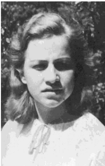
Slava Klavora, narodna herojina

Prvo civilno žrtev (nemškega) okupatorja moramo logično iskati na področju, kjer so nemške vojaške enote aprila 1941 vdrle na slovensko ozemlje. Iz vojaške zgodovine gre za tri točke: prva je Dravograd, kjer je v večdnevnom boju padlo 23 vojakov VKJ (med njimi morda tudi kakšen Slovenec), katerim je postavljen tudi spomenik; druga točka je Gornja Radgona, kjer sem