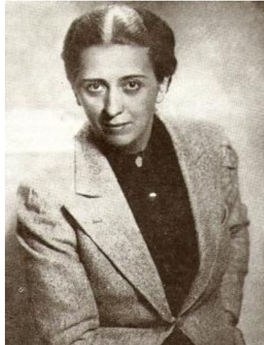
Pavla Jesih, (1901–1976)

k njej pošiljal stražnika Kokalja, ki ji je prinašal pisma, živilske karte in podobno;