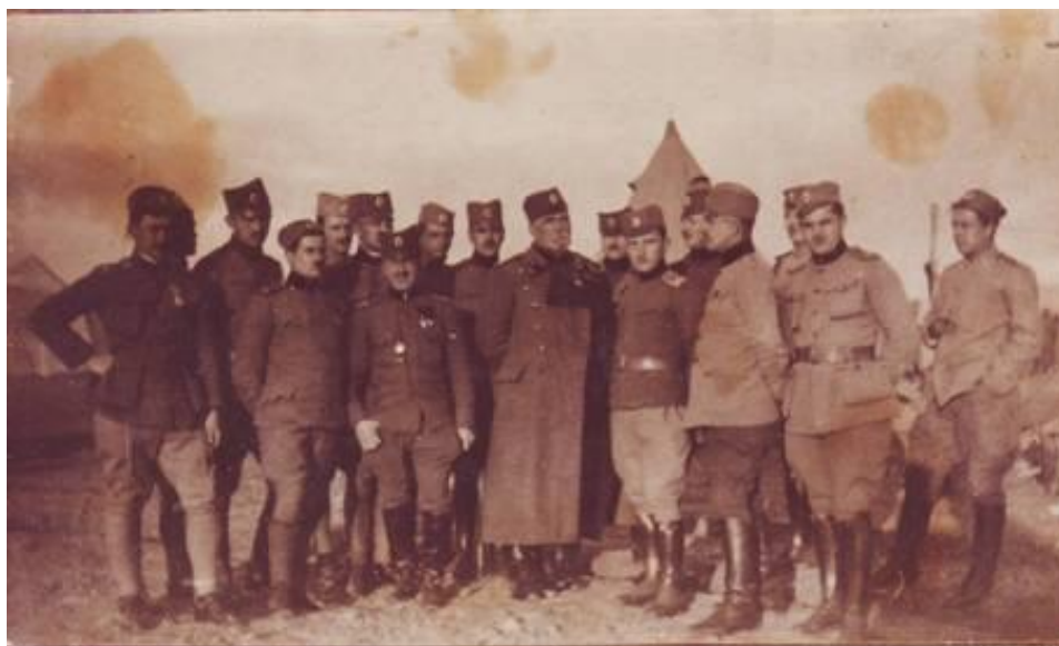
Slovenski častniki – dobrovoljci (preporodovci) srbske vojska na solunski fronti 1918 v družbi polkovnika Janka Stibel - Vukasovića, poveljnika srbskega orožništva 4 .

Da bi pa načrtovali kakšen atentat, kakor omenja Golubić, pa zaenkrat ni znano.