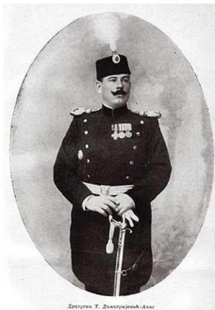
Polkovnik Dragutin Dimitrijević - Apis

sodeloval tudi v razpletu jugoslovanske krize marca in aprila 1941. Zato sem tudi predhodno objavil članek o notranji partijski zaroti iz svoje knjige Zarote in atentati na Tita , kjer sem navedel tudi naslednje: »Golubić je bil zelo tesno povezan s polkovnikom Dragutinom Dimitrijevićem - Apisom, šefom srbske vojaške obveščevalne službe. V obdobju premirja, 1913–1914, je v Toulussu študiral pravo. Sodeloval je tudi v pripravah atentata na avstro-ogrskega nadvojvodo Franca Ferdinanda v Sarajevu 1914«.