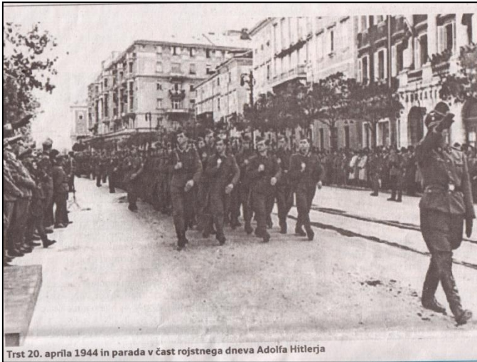
Trst 20. aprila 1944 in parada v čast rojstnega dneva Adolfa Hitlerja