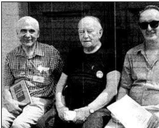
Pred cerkvijo sv. Duh na Stari gori, 2003