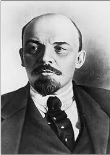
Vladimir Iljič Uljanov - Lenin (1870–1924)

Zagotavljala je finančno in organizacijsko pomoč komunističnim funkcionarjem, ki so se borili za oblast in izvedbo svetovne komunistične revolucije. Podpirala je državne prevrate komunistov v različnih državah, vendar zahtevala, da se vse komunistične partije v svojem delovanju strogo podredijo Moskvi.