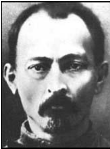
Feliks Edmundovič Dzeržinski

ČEKA – Izredna vseruska komisija za bojevanje proti kontrarevoluciji, špekulacijam in sabotажam (po rusko: Vserossijskaja čezvičajnaja komisija po borbe s kontrevoljuciej, spekulacijacijej i sabotажem) je bila ustanovljena 20. 12. 1917. Njen prvi direktor je bil Feliks Edmundovič Dzeržinski (1877–1926), sicer Poljak po narodnosti, pozneje tudi notranji minister ZSSR.