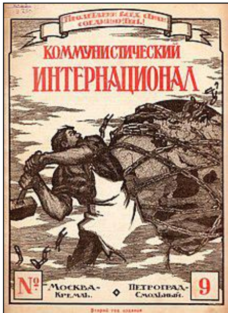
Glasilo Kominterne

Komintern – Komunistična internacionala (po rusko: Komintern, Kommunističeskij Internacional), tudi Tretja internacionala , je bila dokaj uspešna in množična mednarodna zveza komunističnih strank in sorodnih gibanj z vsega sveta, ki so se opredelile za svetovno (nasilno) »proletarsko« revolucijo.