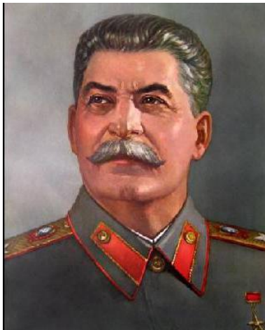
Josip Visarionovič - Stalin (1879–1953)

Zagotavljala je finančno in organizacijsko pomoč komunističnim funkcionarjem, ki so se borili za oblast in izvedbo svetovne komunistične revolucije. Podpirala je državne prevrate komunistov v različnih državah, vendar zahtevala, da se vse komunistične partije v svojem delovanju strogo podredijo Moskvi.