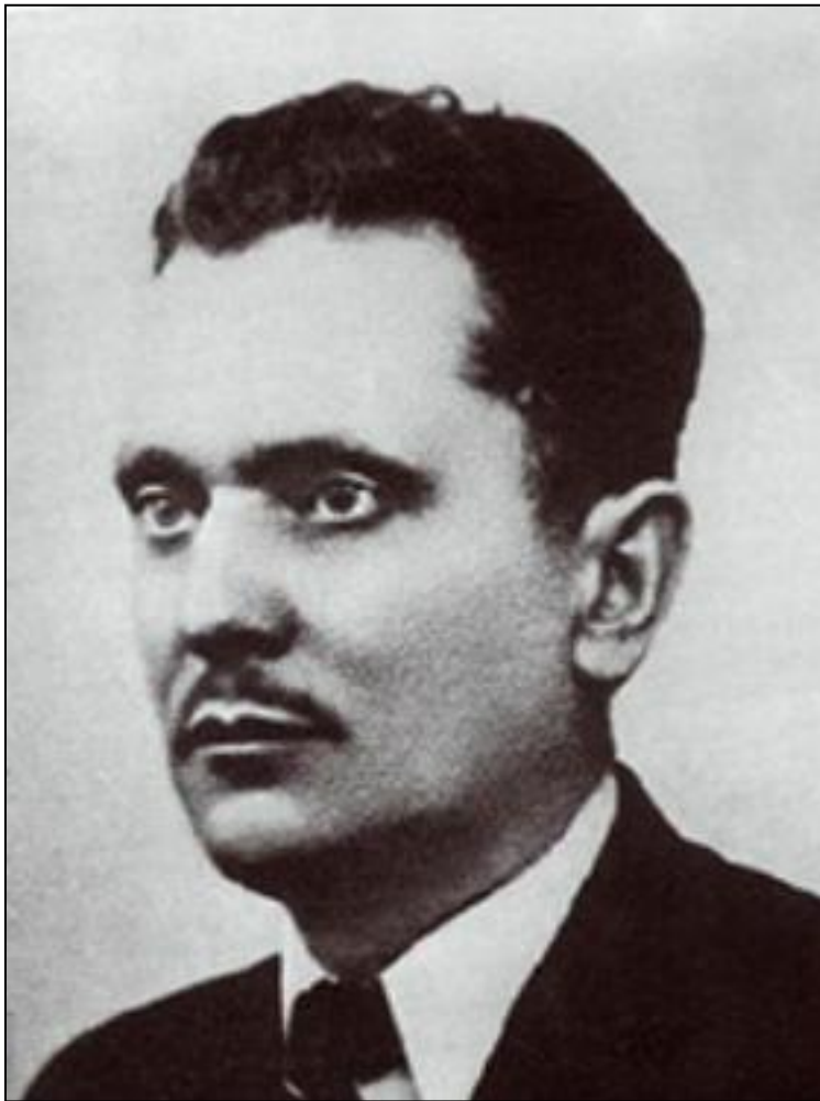
Josip Broz - Walter (1892–1980)