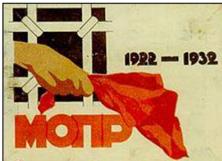
MOPR – Mednarodna rdeča pomoč

MOPR – Mednarodna organizacija pomoči delavcem oz. borcem revolucije (po rusko: Международная организация помощи рабочим - борцам революции ) je bila v obdobju 1921–1941 solidarnostna organizacija delavskega razreda, ki je nudila pomoč političnim zapornikom in žrtvam protikomunističnega terorja in njihovim družinam, dejansko pa je bila oddelek Kominterne za široko razpredeno podtalno delovanje v kapitalističnem svetu.