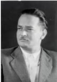
Boris Kidrič, 1943