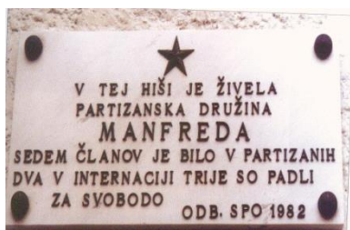
Spominska plošča, Hum, 1982