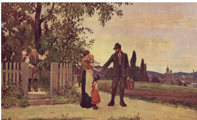
Kolekcija fotografij o 97. tržaškem pehotnem polku – odhod od doma